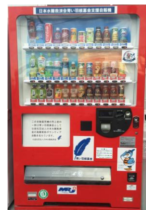
青い羽根募金支援自販機

建設工事現場に設置している支援自販機には、本会の指定したデザインが使用できないことから、同自販機には青い羽根やきゅうすけクンシールが貼られています。