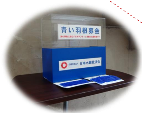
国土交通省（3号館）1階及びB1階に 設置された青い羽根募金箱