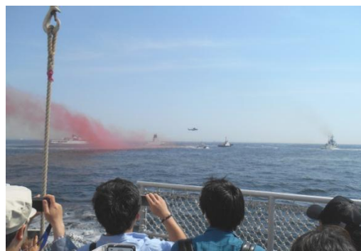
海難救助・海上防災訓練