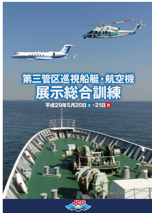
海上保安庁広報用リーフレット