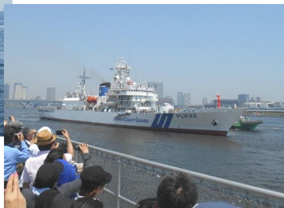
出港中の巡視船やしま