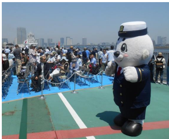
海上保安庁マスコットキャラクター「うみまる」(巡視船やしま乗船)、うーみん(巡視船つがる乗船)も参加