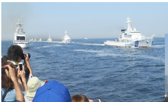
視閲を受ける受閲船隊